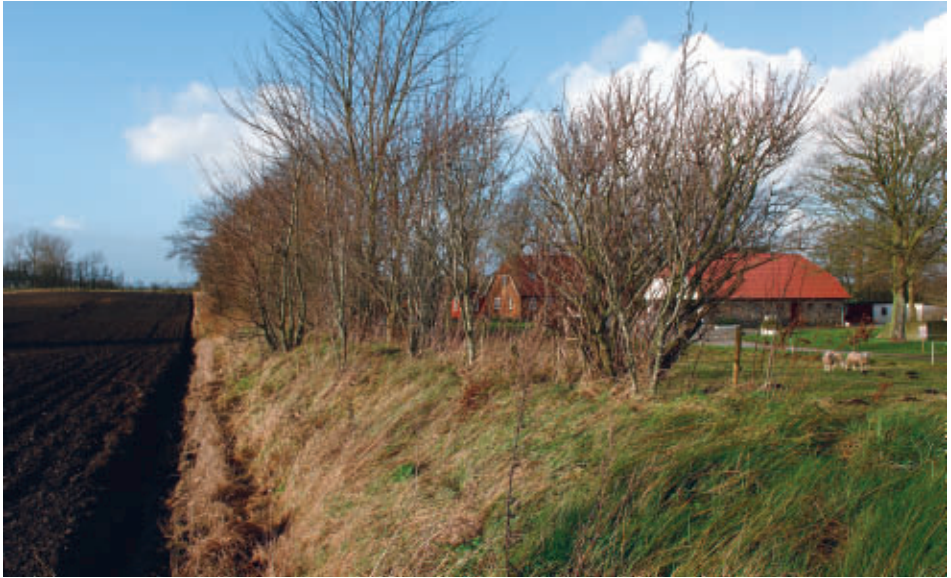
Ejerlavsdiget mellem Fiskbæks overdrev og Viborgs udmark udgør også sogneskellet.