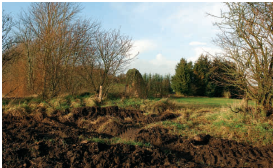
Algestenen i Viborg bymarks nordvestlige hjørne er rejst i trepunktsskellet mellem Viborg mark og sognene Fiskbæk og Vorde. Den markante skelsten blev i 1488 omtalt under navnet »Halgadstenen«.