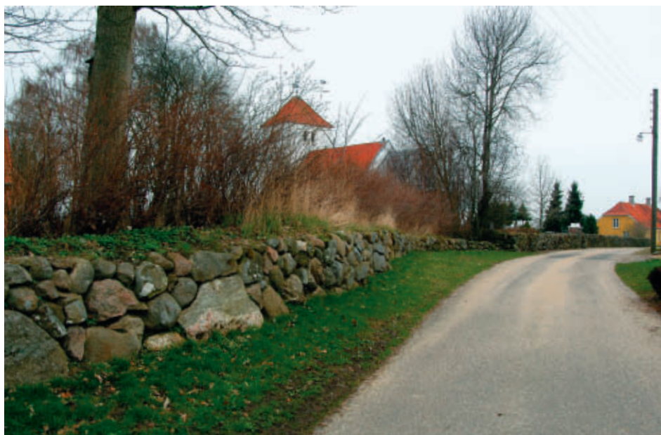
Præstegårdsdiget i Vinkel, velholdt med et svagt buet forløb. Det efterfølges af kirkegårdsdiget, som er rettet til i moderne tid. I baggrunden landsbyens ældste skole, som senere blev fattighus.

Oprindeligt var hovedgårdene en del af landsbyens fællesjord, men i løbet