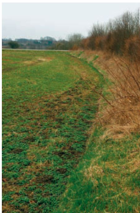
Det velbevarede hovedgårdsdige mellem Randrup gods og Vinkel bymark.

De store landboreformer, som for 200 år siden opløste landsbyfællesskabet og skabte den moderne selvejerbonde, satte meget markante spor i kulturlandskabet. Jorden blev fordelt, så de enkelte gårde fik markerne samlet. I mange landsbyer flyttede gårdene ud på den udstykkede jord, mens andre