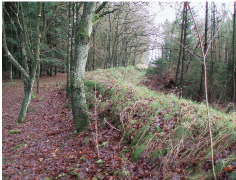
Stendal Plantage. Skoven er udvidet, så skovdiget i dag ligger inde i plantagen.

Initiativrige folk gik i 1800-årene også i gang med at plante skov på den jyske hede. Her blev skovparceller også beskyttet mod løsgående dyr, men en del af digerne tjente også som