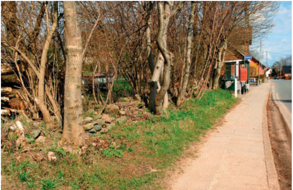
Det gamle toftedige ud mod bygaden i landsbyen Vinkel er slidt af tidens tand. Engang markerede det gårdens enemærke.